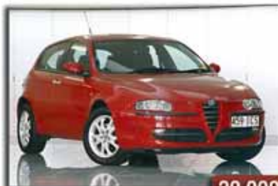
Alfa 147 JTDM 120 5P Sport 20.000€ Año 2008 - Climatizador bizona Reposabrazos central