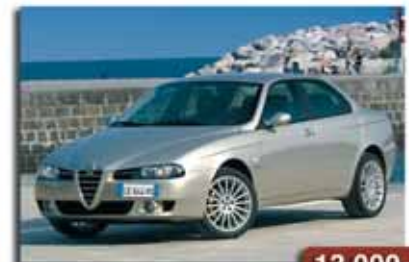
Alfa 156 JTD 115 Distinctive 13.000€ Año 2004 - Climatizador - ABS Llantas - Sport