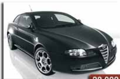
Alfa GT JTD 150 Sport 28.000€ Año 2006 - Tapicería de piel - Llantas de 18" - Pintura Metalizada - Full equip