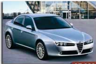
Alfa 159 JTDM 150 Q-Tronic 27.000€ Año 2007 - Distinctive - Blue&Me - Llantas de 17" - Pintura Metalizada