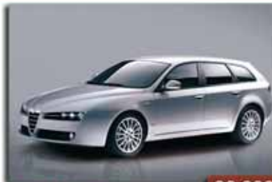
Alfa 159 SW JTDM 20v 200 30.000€ Q-Tronic Año 2007 - Techo solar - Barras Full equip