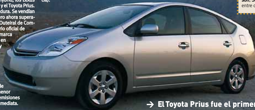
→ El Toyota Prius fue el primero del mercado