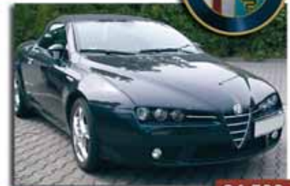
Alfa Spider 2.2 JTS 34.500€ 185 Skyview Año 2007 - Tapicería de piel - Llantas de 17" - Pintura Metalizada