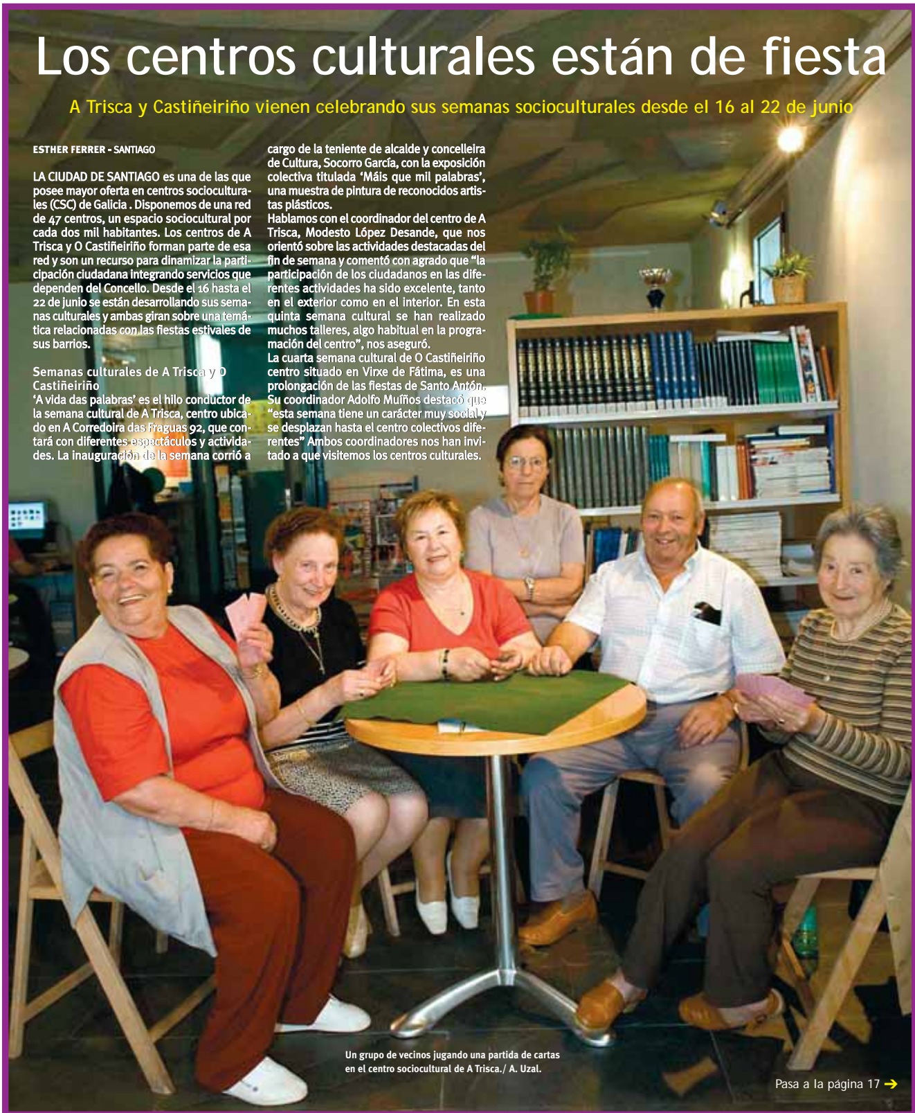
Un grupo de vecinos jugando una partida de cartas en el centro sociocultural de A Trisca