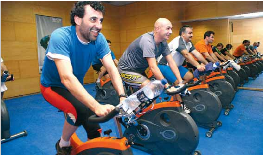
El 20% de los españoles reconoce acudir habitualmente a los gimnasios, aunque la mayoría no lo hace a diario.