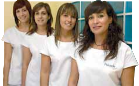
NÁYADE CENTRO DE BELLEZA

20 millones de mujeres todo el mundo tienen ya en su cuerpo algún tipo de prótesis.